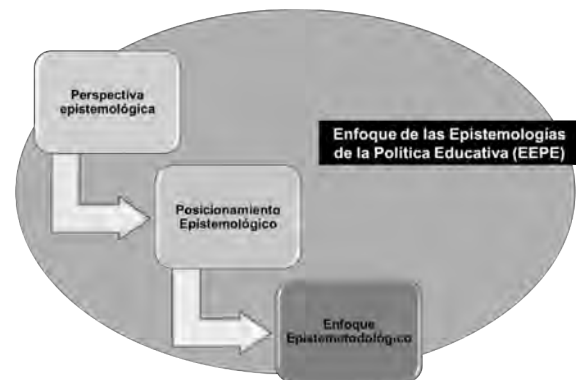
Figura N° 1 EEPE

El enfoque epistemológico es el momento metodológico donde el investigador opta por una u otra metodología. “No consideramos a los “enfoques metodológicos” como meros instrumentos sea de recopilación, sea de análisis de la información. Sino como el “método del logos”, esto es el modo de pensar el logos. Por tal razón preferimos hablar de epistemología, categoría en la que confluyen la presentación de método y la posición epistemológica del investigador” (Tello, 2012, p. 292).