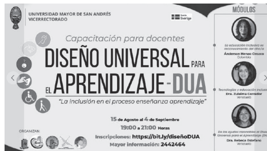
Figura 3. Fotografía de la invitación a la Capacitación