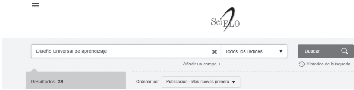
Figura 1: Captura de búsqueda en repositorio Scielo